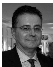
Daniel RODRIGUEZ ELSEVIER-MASSON