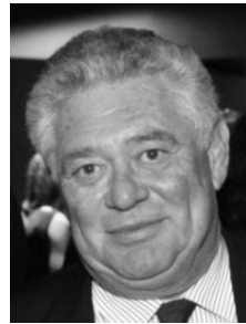
Gilles CAHN JOHN LIBBEY EUROTTEXT LIMITED