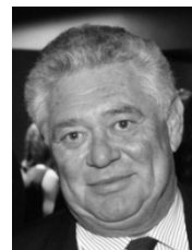
Gilles CAHN JOHN LIBBEY EUROTEXT LIMITED