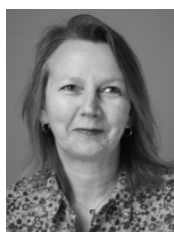
Nathalie HUILLERET SPRINGER VERLAG France