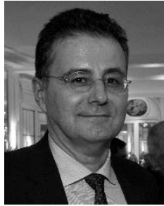
Daniel RODRIGUEZ ELSEVIER-MASSON

Suite au Conseil d'administration du 21 novembre 2018