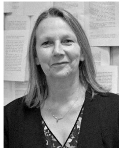
Nathalie HUILLERET SPRINGER VERLAG FRANCE